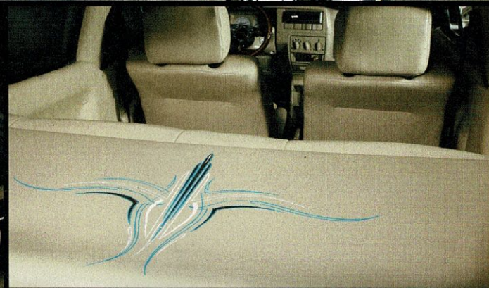
Oben links: Der Polo könnte glatt das Meisterstück des 25-Jährigen sein. Er ist Kraftfahrzeuglackierermeister Oben rechts: Ein Teil der sogenannten Scrollstripes, die für den abgefahrenen Leuchteffekt verantwortlich zeichnen Unten links: Das Volant ist der spektakuläre Höhepunkt eines stimmigen Innenraums. Die Basis ist ein 30er Raid, der Kranz ein Eigenbau Unten rechts: Farblich passend zum Design des Außenlacks finden sich Pinstripes im Interieur