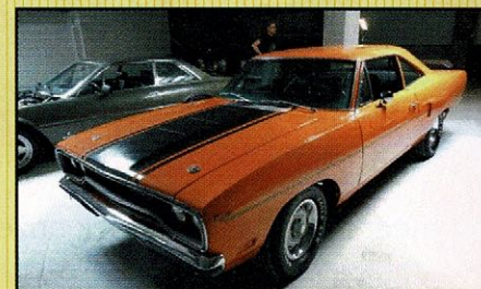
Plymouth Roadrunner 1970 Hier een perfecte Plymouth Roadrunner uit 1970! Er zit een hele sterke 383 motor in! Het is een hele mooie gerestaureerde auto!