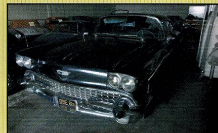
Cadillac sedan 1958 Solide en originele '58 Cadillac Sedan. Goed rijdende auto met een hele sterke motor!