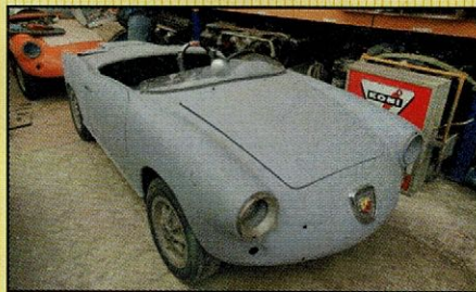
Abarth Allemano spider 1958 Mooie en zeldzame Abarth Allemano spider "gevonden"! Deze Allemano is om te restaureren. Wel zeer gaaf mooie complete body.