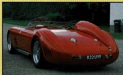
Maserati 450S 1959 Gereviseerde 4.9 ltr, 8 cil Maserati Motor. aluminium body, helemaal perfect. Borrani wielen, super auto met Engelse registratie.