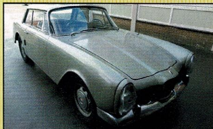
Facel Vega Facellia coupé 1962 Heel aardige Facel Vega Facellia uit 1962. De originele motor is gereviseerd. De auto rijdt perfect. Hij is compleet en origineel!