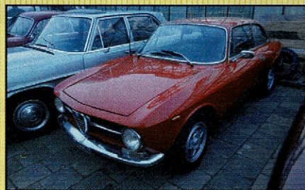
Alfa Romeo Bertone Junior 1971 Wat is ie mooi! Perfect rijdend, echt één voor dagelijks gebruik. Met Duits kenteken.